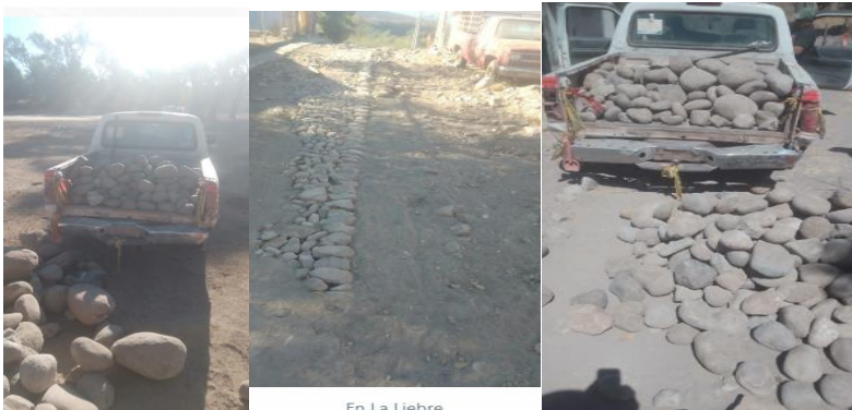
En La Liebre

Este día terminamos la remodelación del pozo de agua en la comunidad de El Cerrito, nos fuimos a empedrar una calle en la comunidad de La Liebre y por la tarde fui a medir una calle a la Comunidad de El Cerrito para meter tubería de drenaje.