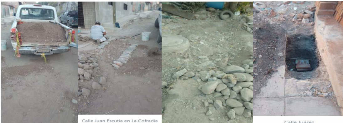
Calle Juan Escutia en La Cofradía

Este día continuamos con la remodelación del pozo de agua en la comunidad de El Cerrito, reparamos un bache por la calle Juan Escutia en La Cofradía y otro por la calle Juárez.