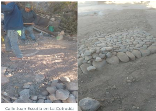
Calle Juan Escutia en La Cofradía