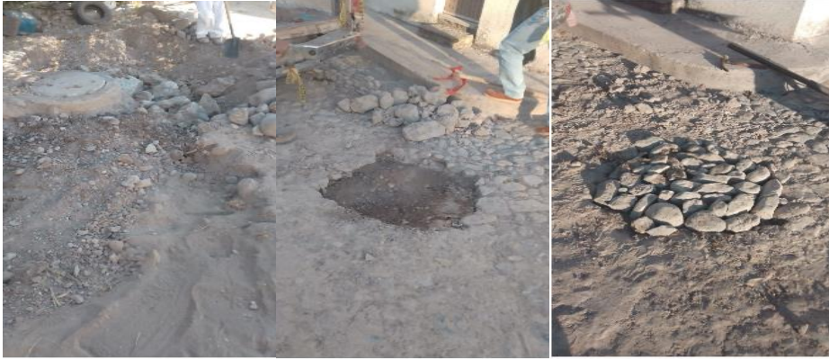
Calle Juan Escutia en La Cofradía

Este día continuamos con la remodelación del pozo de agua en la comunidad de El Cerrito, reparamos un bache por la calle González Ortega en la colonia guadalupana y otro por la calle Juan Escutia en La Cofradía.