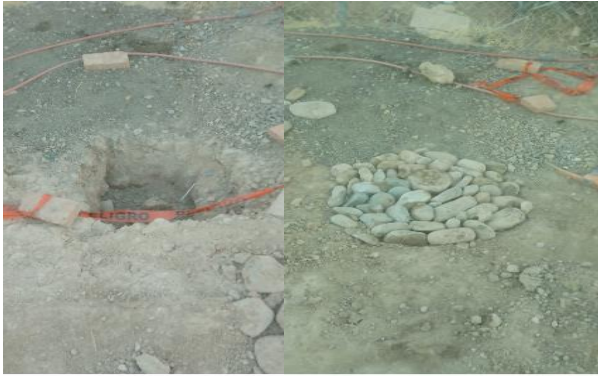
Calle Luis Donado Colosio