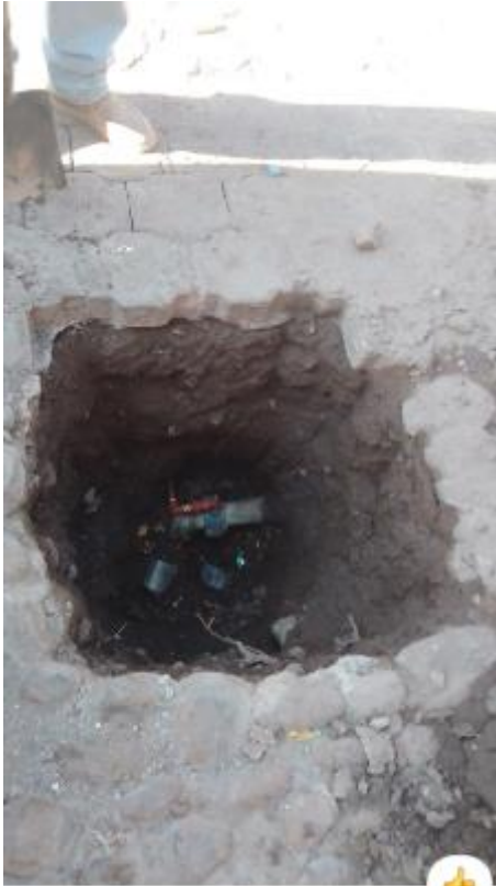
Calle Vicente Guerrero