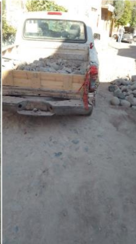
Calle Pino Suárez