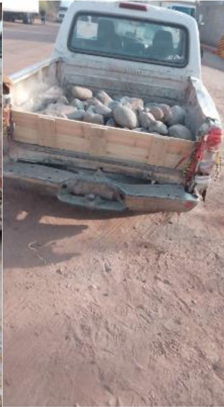
Empedrado en calle Pino Suárez