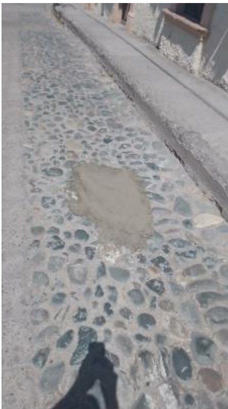
Bache en Calle Vicente Guerrero