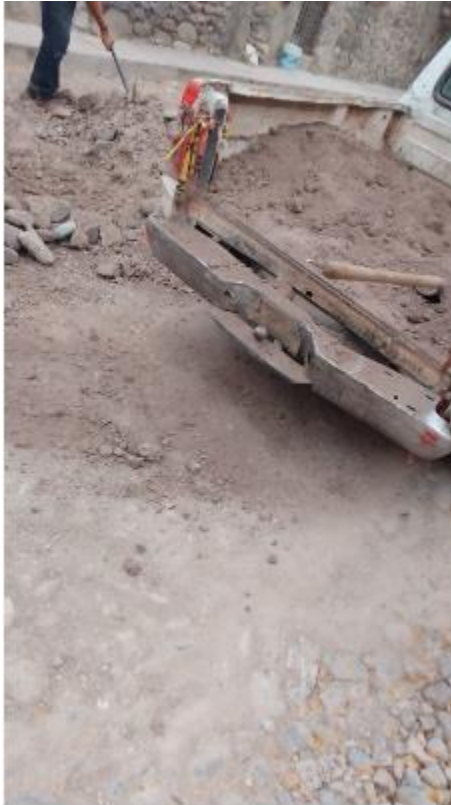
Empedrado en calle Pino Suárez