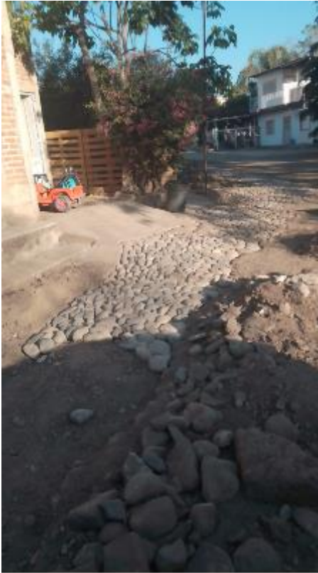
Empedrado en calle de El Paso