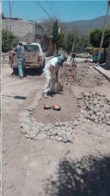
Calle Pino Suárez