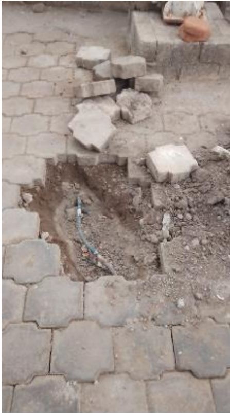
En El Cerrito de La Navidad