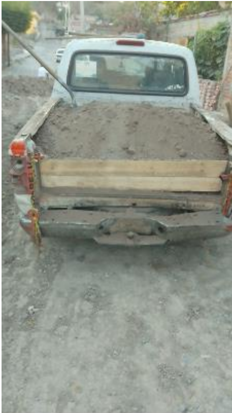
Calle Pino Suárez

Este día continuamos con remodelación de baños y construcción de calle con piedra ahogada en concreto en la comunidad de San Isidro, continuamos arreglando un bache y empedrado por la calle Pino Suarez en la colonia Guadalupana.