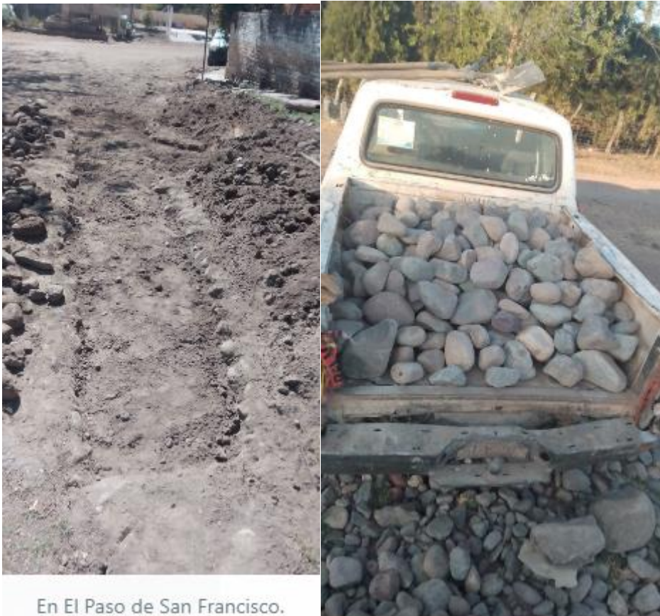
En El Paso de San Francisco.