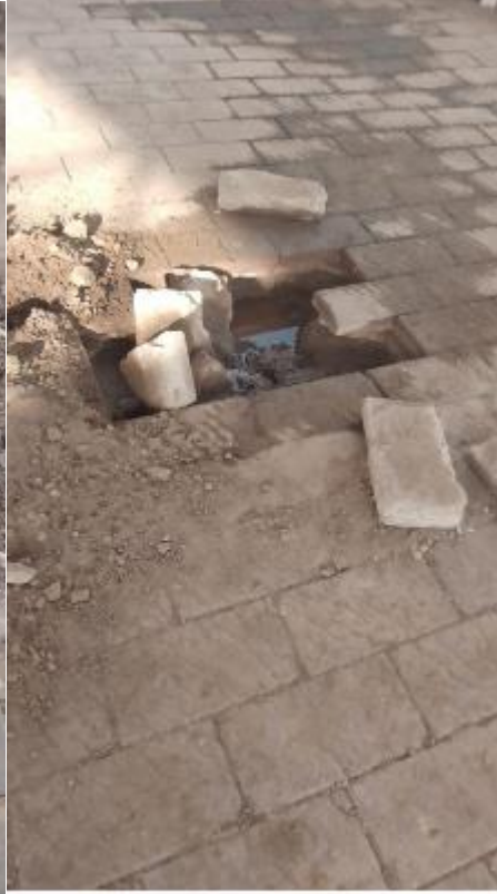
En El Cerrito de la Navidad