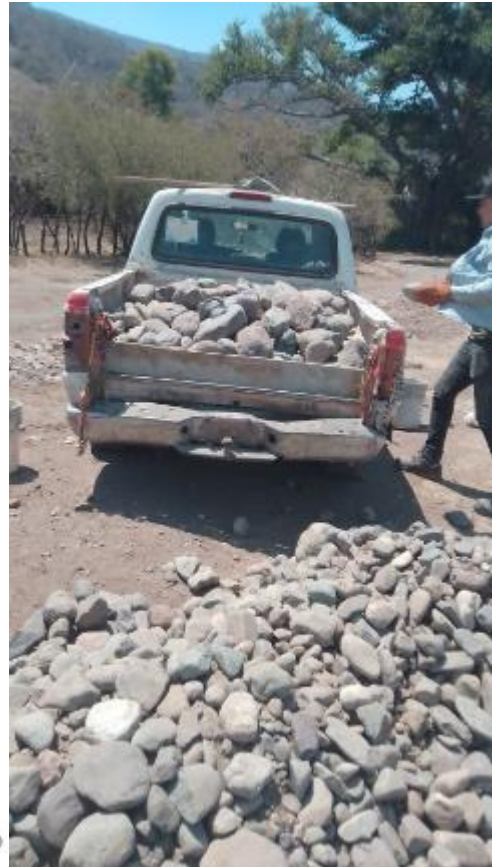
Retirando escombros de Calle Vicente Guerrero