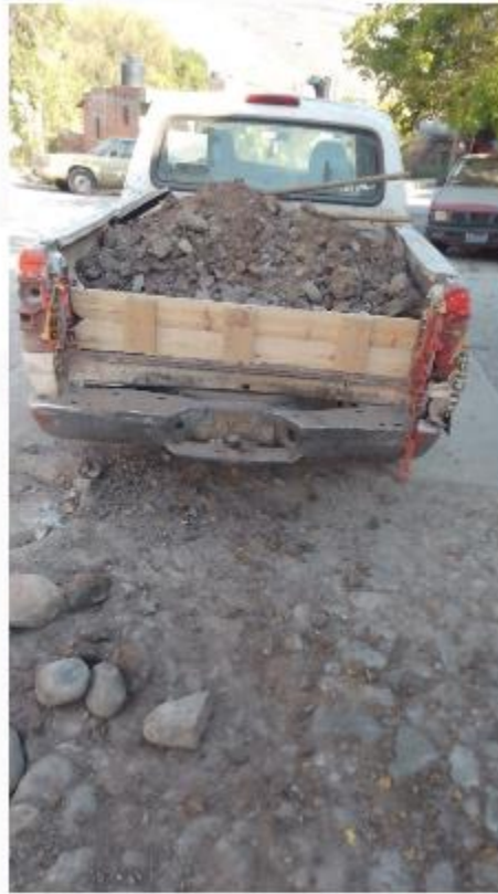
Tirando escombros de calle Pino Suárez