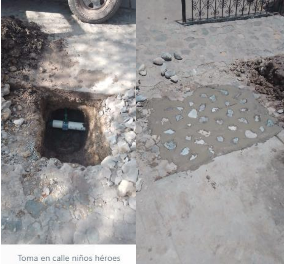
Toma en calle niños héroes

Este día continuamos con remodelación de baños y construcción de calle con piedra ahogada en concreto en la comunidad de San Isidro y arreglamos un bache que dejan los fontaneros en toma por la calle Niños Héroe e la cabecera municipal.