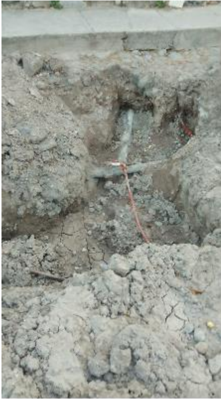
Calle Pino Suárez