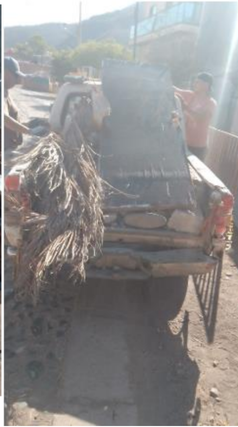
Escombros kinder de La Cofradía