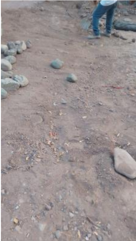
En San Luis Tenango