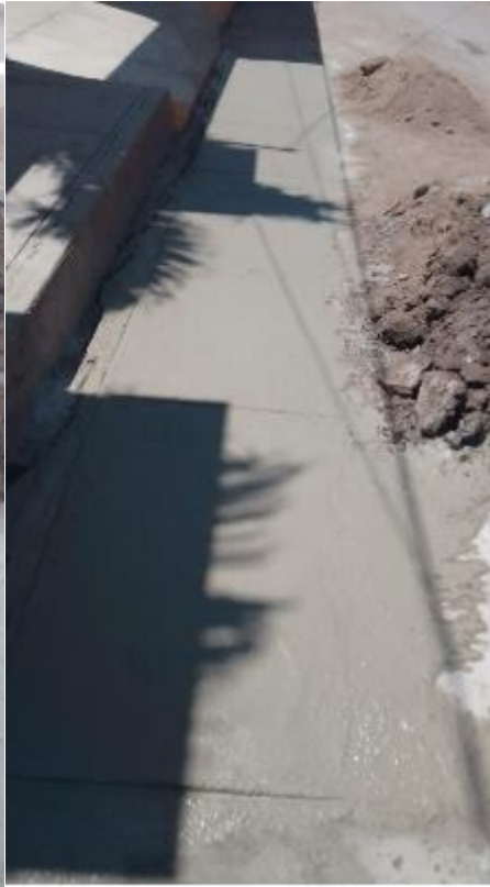
Listo en Calle Juárez